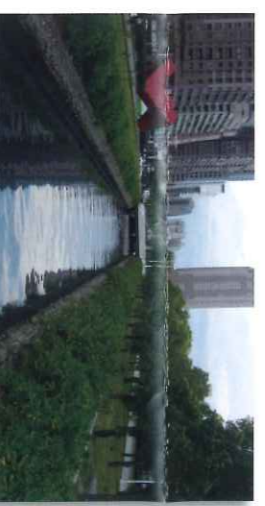
新光路排水名渠水质改善(台湾·高雄市)