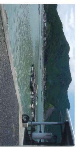
湖的净化(用杜斯有名的「白石湖」)