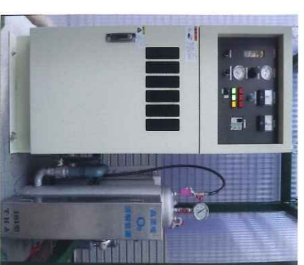
〔除臭·漂白·杀菌〕 高浓度O3溶解

利用微生物可以使水中的有机物变成无机物。但在缺氧的环境下,会因厌氧性微生物的作用而产生氨(NH3)、硫化氢(H2S)、甲硫醇(CH3SH)等恶臭气体。(也会产生CH4(甲烷),但它是无臭的)在有充足氧的环境下,又会因好氧性微生物的作用使有机物转换为水(H2O)和二氧化碳(CO2),不会产生其他的硝酸(NO3)、硫酸(SO4)等恶臭。