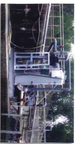
养猪场排水净化·恶臭改善(高浓度废水对应)