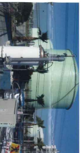
硫化氢消除 (火电站・食品工厂)